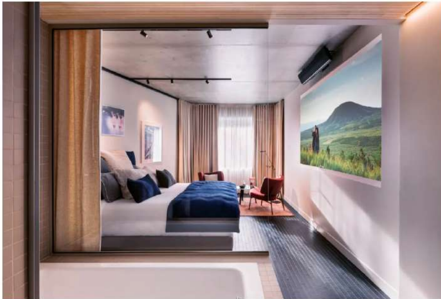
Une chambre de l'Hôtel Paradiso

En attendant la réouverture des salles, c'est à l'hôtel qu'il faut désormais se rendre pour voir des films : à Paris, la chaîne MK2 inaugure "l'Hotel Paradiso", un établissement où les cinéphiles peuvent s'organiser des séances à la carte sur écran géant.